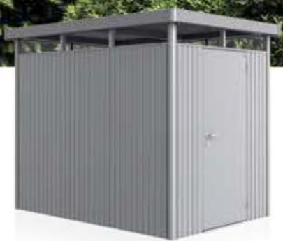
Abb. Größe H2 Die Standardtüre kann ab Größe H2 in jeder Seitenwand eingebaut werden.