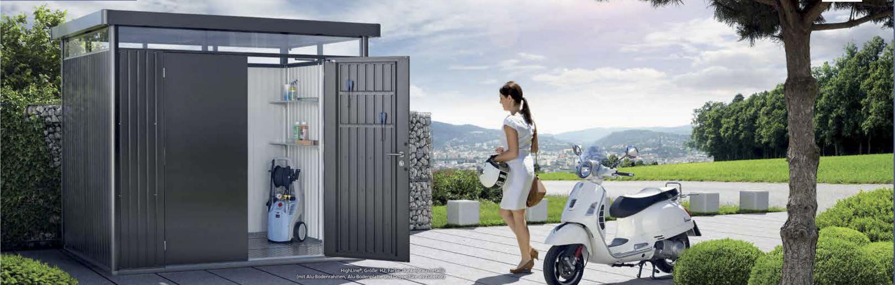
HighLine®, Größe: H2, Farbe: dunkelgrau-metallisch (mit Alu-Bodenrahmen, Alu-Bodenplatte und Doppeltüre als Zubehör)