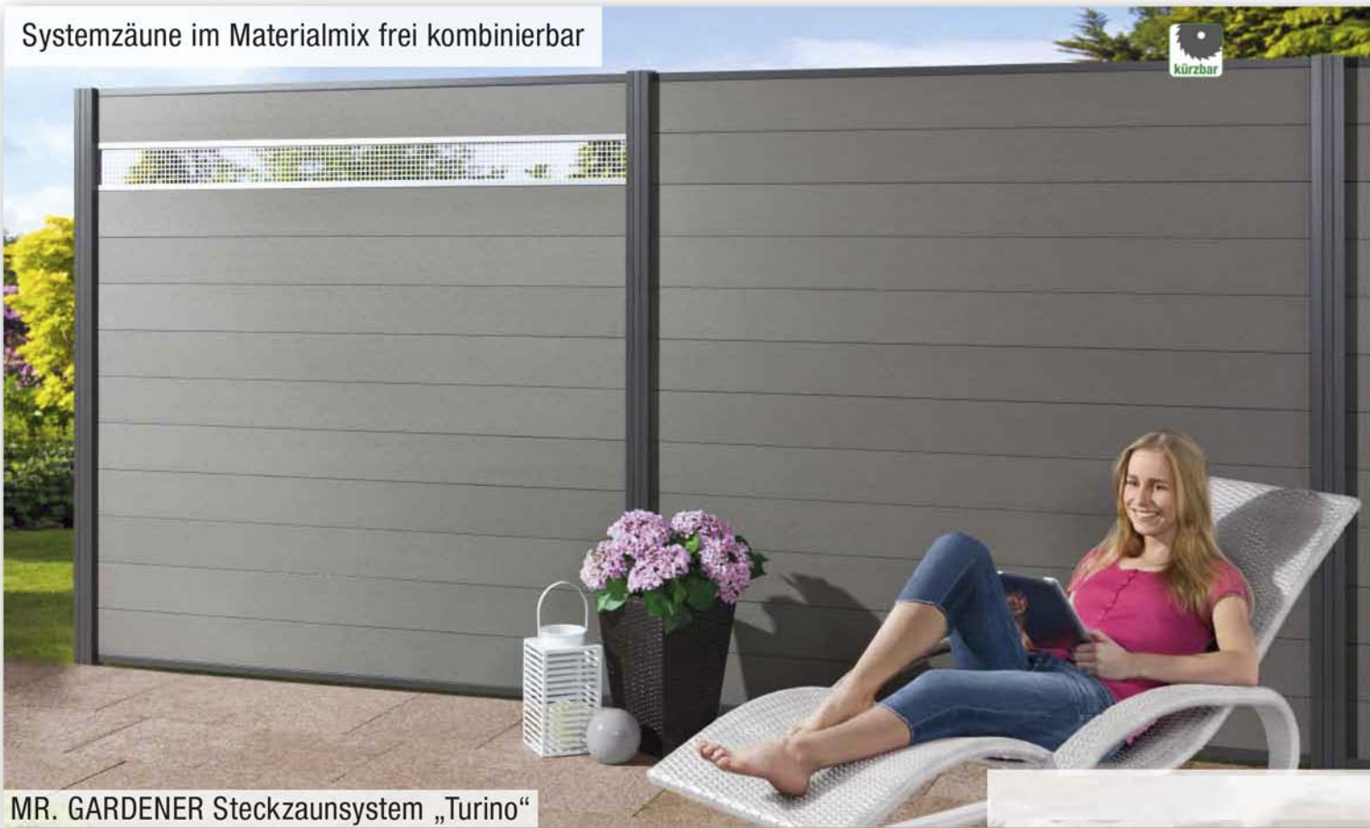
MR. GARDENER Steckzaunsystem „Turino“